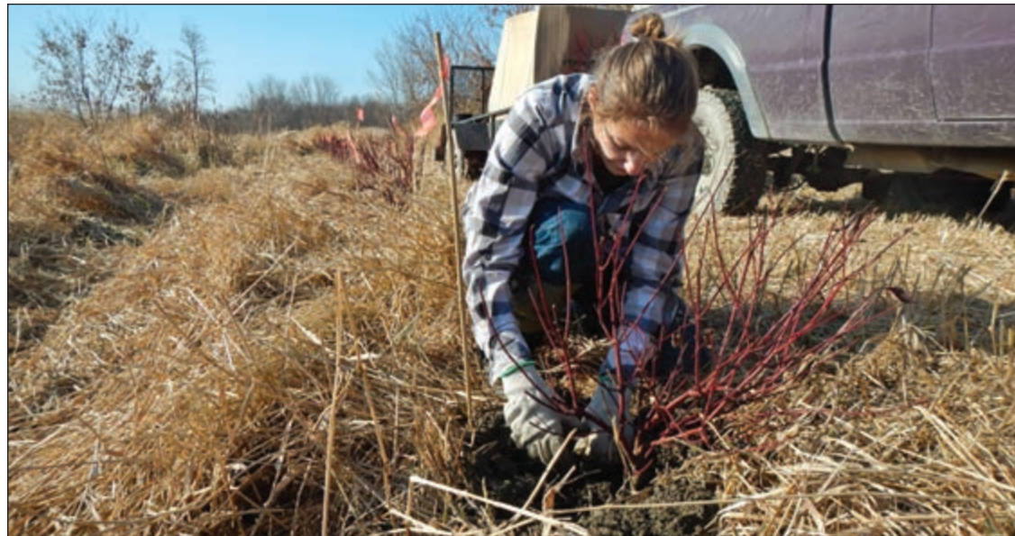
La plantation consistait en un rétablissement d'une bande riveraine constituée d'une végétation indigène caractéristique de la plaine inondable du lac Saint-Pierre.